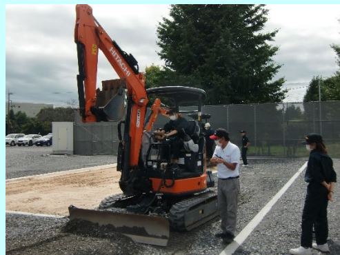
活動している様子 (ICT 機械試乗体験)

山梨県内にある教育機関(大学、高等学校等)、NPO法人若しくは営利を目的としない団体又はこれらに所属する方。