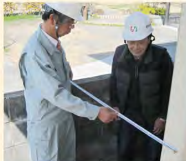
建築基準法完了検査