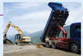
初狩ストックヤード

公共工事により発生する建設残土の処分について監視し管理します。また、社会資本整備に関する各種事業への参加など、啓発・啓蒙活動にも積極的に支援・協力します。