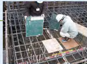
工事管理(鉄筋検測)