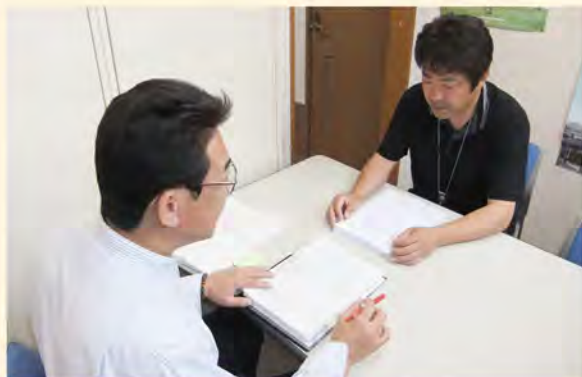
建築確認申請事前相談及び書類審査

エコポイント取得の申請窓口業務と「住宅版エコポイント制度」に基づく新築エコ住宅(一戸建ての住宅)のエコポイント対象住宅証明書の発行業務を行っています。