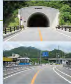
◀国道137号山宮トンネル

当センターの主力業務として、積算業務を中心に、公共事業の適性かつ円滑な執行を補完・支援します。