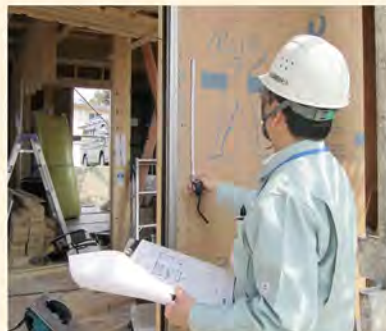
フラット35中間現場検査