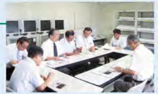
橋梁長寿命化策定会議

市町村が的確な計画が策定できるよう、専門的知識を有する学識経験者等の意見を聴取できる態勢を常時整え支援します。