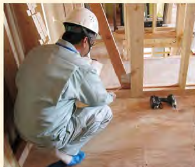
建築基準法中間検査