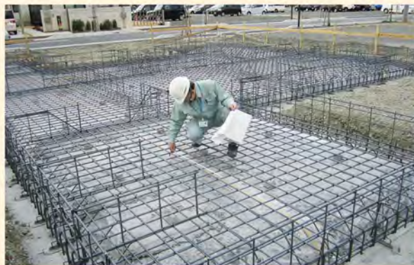
住宅瑕疵担保責任保険基礎配筋検査