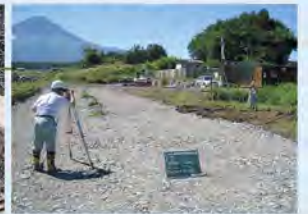
工事管理(丁張検査)