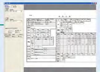
道路台帳システム

道路や橋梁等の施設の特性に精通した者がデータ内容を照査の上入力を行い、適時適切に管理者が活用できるよう整えます。