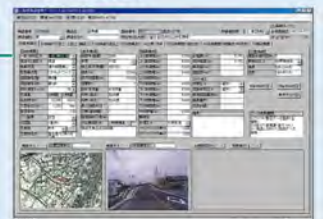
橋梁台帳システム

市町村にシステムを無償提供します。活用にあたっては、市町村の実情を踏まえた丁寧な支援に努めます。